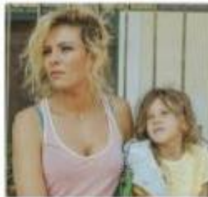
Filme verschiedenster Genres werden gezeigt.

Anhand verschiedener Filmgenres möchten wir Ihnen ein